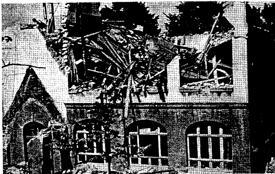
Das Dach ist eingestürzt, die Fensterscheiben sind zerbrochen, nur noch Umrisse im Mauerwerk erinnern an die alte spitzgieblige Vorhalle.

Fußböden, die im Laufe der Jahre durch viele Jungenstiefel pechschwarz geworden waren.