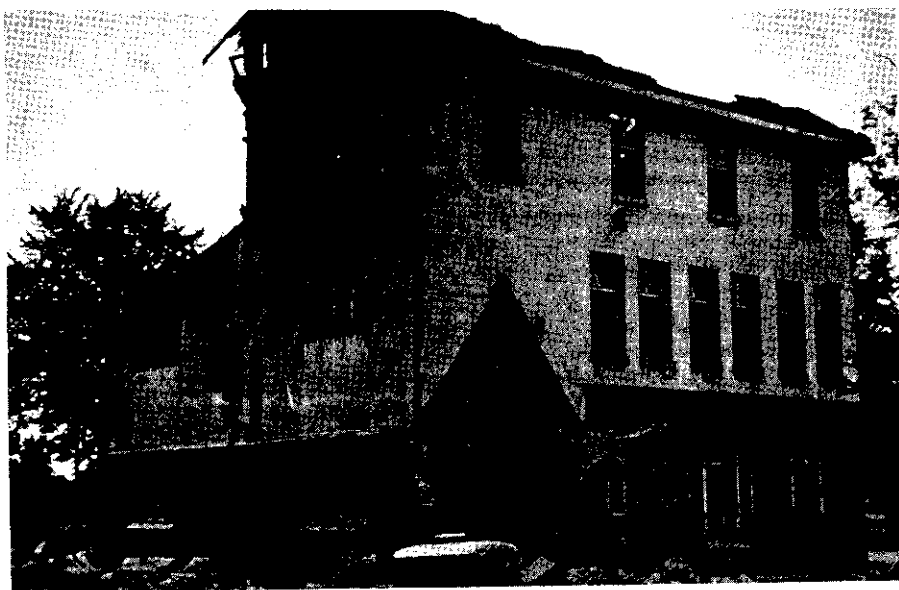
Die Mauern fallen, der „Fuchsbau“ ist nur noch eine Ruine - ein altes Schulgebäude mit Tradition wird abgebrochen

Ohne die Leistungen und Fähigkeiten der Lehrer an der alten Schule in irgendeiner Weise schmälern zu wollen, kann man doch sagen, daß mit dem neuen Gebäude ein neuer Geist und eine neue Sicht von Erziehung Einzug hielten.